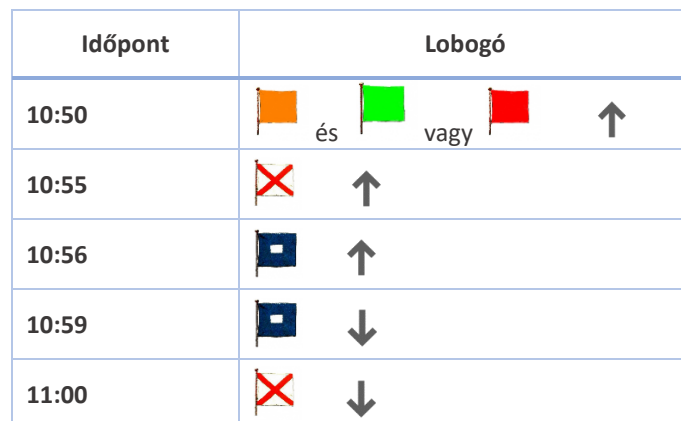
1. táblázat - Rajtjelzés